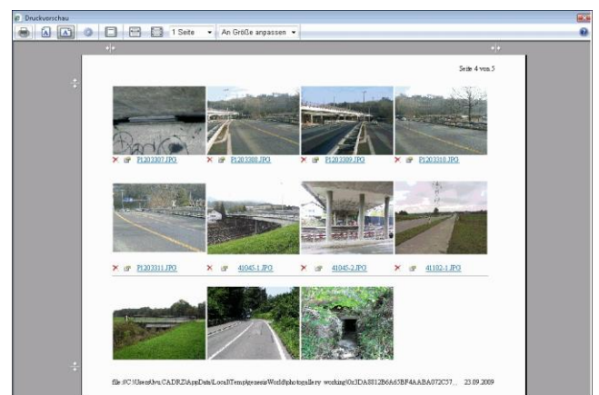
Grafik 2: Druckvorschau